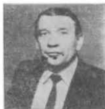
Е. ВОЙТОВИЧ, начальник Главного управления кинофикации и кинопроката Госкино СССР

Июньский 1983 г.) Пленум ЦК КПСС поставил задачу поднять на новый качественный уровень воспитательную работу, в том числе и средствами кино. Кинорепертуар сегодня должен удовлетворять возросшим требованиям зрителей. В контексте этих повышенных требований мы обязаны критически взглянуть на итоги деятельности киносети и кинопроката в минувшем году, выявить резервы улучшения работы с фильмами, по-деловому разобраться в вопросах экономики, предусмотреть совершенствование хозрасчета и укрепление материально-технической базы киносети и кинопроката.