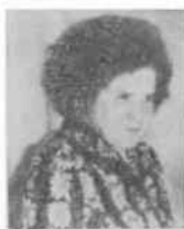
Н. КОТАНОВА, Кадыйский район Костромской обл. РСФСР

Неудовлетворительно соблюдаются на сельских киноустановках правила техники безопасности. У нас в районе нет организации, которая могла бы проверить заземление киноаппаратуры. К тому же нет возможности приобрести диэлектрические коврики и перчатки, снабжение которыми должно быть централизовано.