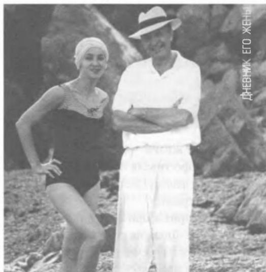
ДНЕВНИК ЕГО ЖЕНЫ

СВЯТОЙ И ГРЕШНЫЙ Россия, по пьесе М. Варфоломеева, реж. И. Соловов