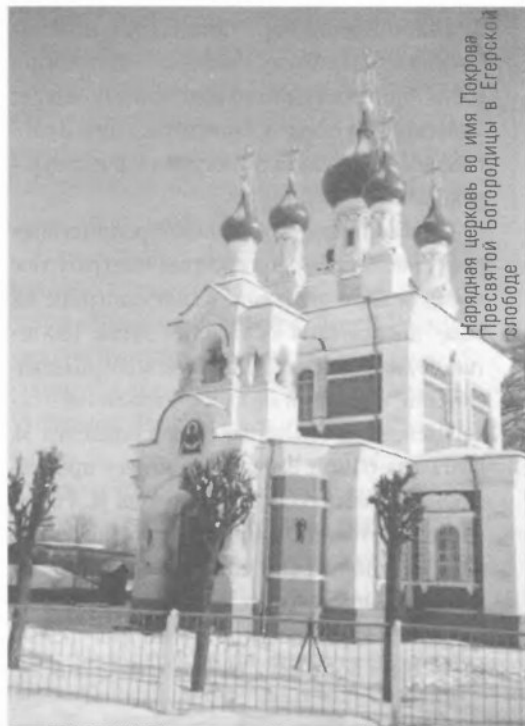
Нарядная церковь во имя Покрова Пресвятой Богородицы в Егерской слободе