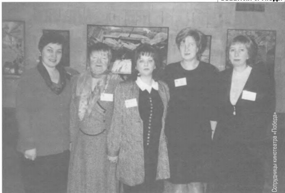
Сотрудницы кинотеатра «Победа»

шую сторону. Изменилось отношение к фестивалю, которому стали помогать и областное правительство, и московское, и Госкино России. Участие губернатора, его статус помогли решать многие проблемы при обращении в государственные структуры. Благодаря поддержке фестивального движения, его значения для города и района, кинотеатру удалось приобрести необходимое оборудование, технические средства, телевизоры, радиомикрофоны. Осталось самое главное и важное — оборудовать Большой зал современной кинопроекционной и звуковоспроизводящей аппаратурой, что значительно повысило бы качество кинопоказа. Безусловно, нужны более комфортные кинотеатральные кресла, экран. Здесь очень надеются на Службу кинематографии Министерства культуры РФ, ведь «Победа» — Центр российского кино. Городские власти не оставляют кинотеатр без внимания: ежегодно выделяется дотация, имеются льготы по оплате коммуналь-