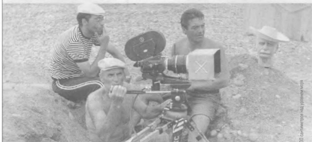
30 сантиметров над уровнем моря