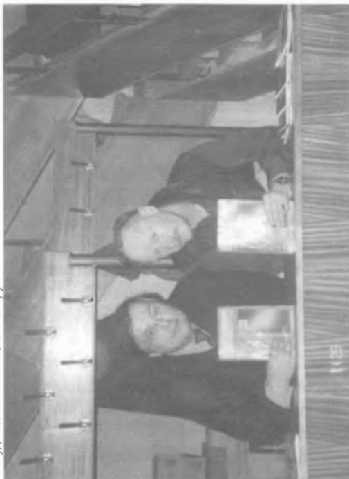
В.Шмыров и актер В.Проскурин с журналом «Киномеханик»