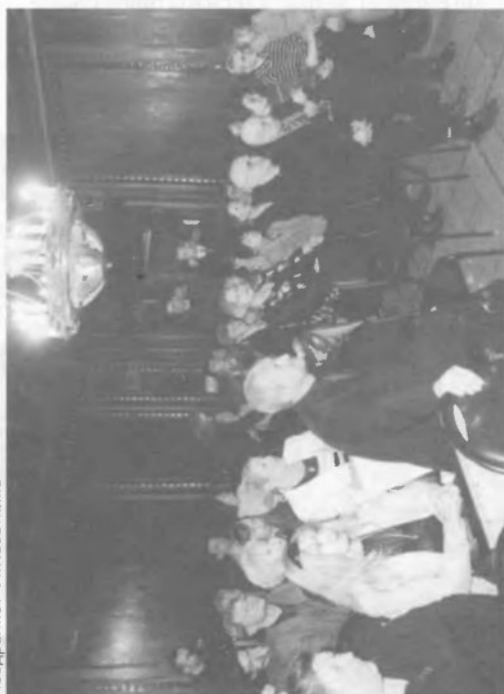
В дубовом зале РА «Информжудино» во время церемонии